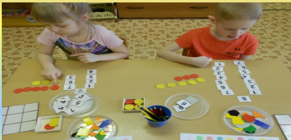
Кружок «Познай - как» (математический кружок)