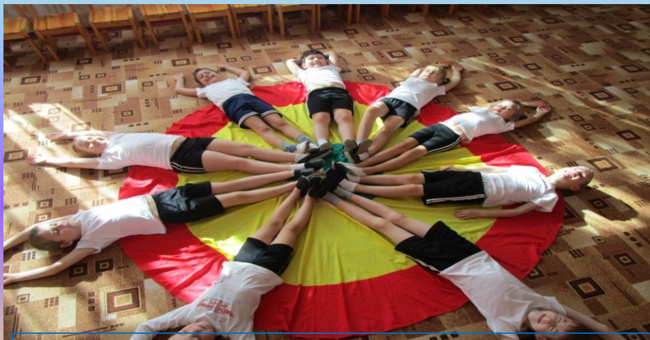
Кружок «Здоровячок» (физкультурно – оздоровительный кружок)