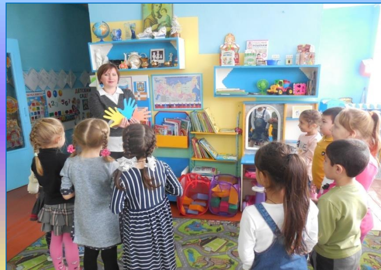
Кружок «Цветик-Семицветик» (психологическая подготовка детей к школе)